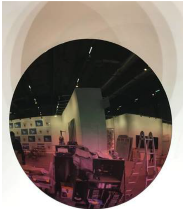
'Mirror', de Anish Kapoor (P.C.)