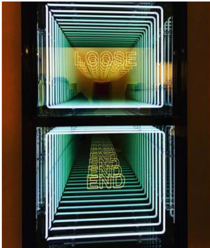
'Loose End', Iván Navarro (P.C.)