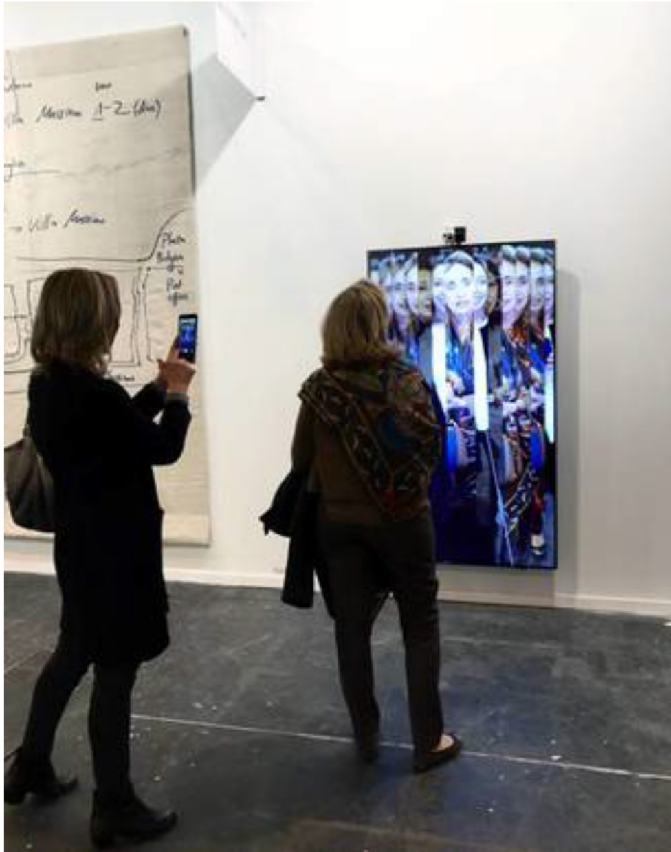
'Bilateral Time Slicer', de Rafael Lozano-Hemmer (P.C.)