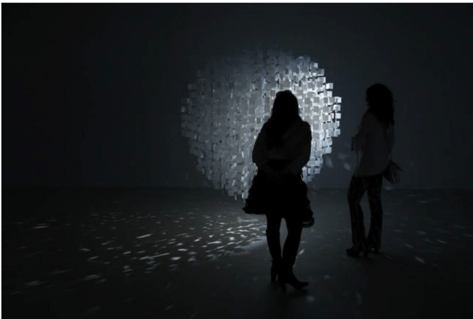
'Sphère blanche' del artista franco-argentino Julio Le Parc