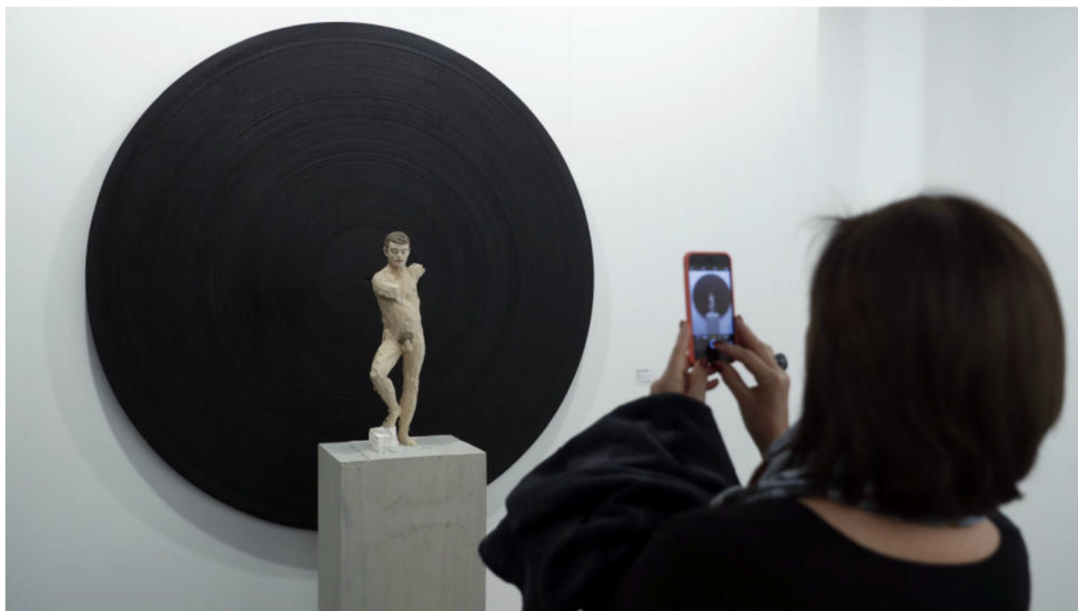
Una mujer fotografía la obra 'Diskus' (2015), del alemán Stephan Balkenhol, en ARCO

Esculturas en las que te reflejas, esferas luminosas y hasta una obra que te fotografía a ti. La exhibición es imprescindible en la feria de arte contemporáneo de Madrid