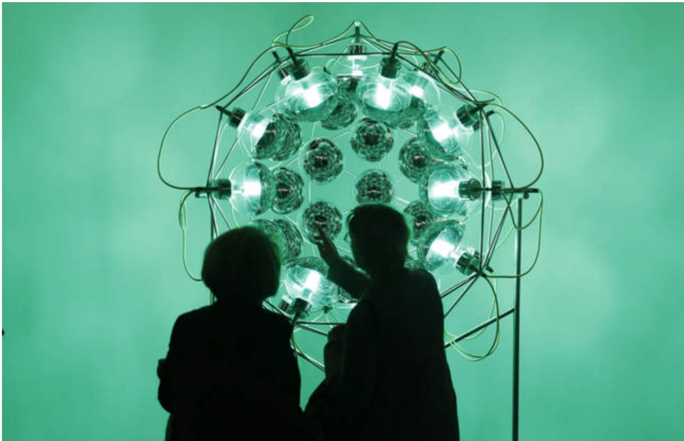
'Global cooling lamp' (2006), de Olafur Eliasson (Efe)

Efectivamente. Lo decíamos antes, pero sin leds de colores la feria parece que está soseada. Si la obra fusiona luz con una frase 'wonderful' o con una estructura compleja, han encontrado la piedra roseta amigos. Y este año tienen donde elegir. La ineludible es 'Global cooling lamp', una estructura de Olafur Eliasson que exhibe la galería Elvira González y que, gracias a su ubicación, se está convirtiendo en el verde y gran objeto de deseo con el que inmortalizarse. La obra —porque no olviden lo que es— es una circunferencia de 140 cm. de diámetro formada por 35 bombillas halógenas (verdes) dentro de "un marco geodésico hemisférico" que, gracias a la composición de sus mitades, reflejan sus tripas. Y, además, es el auténtico caza selfies de ARCO.