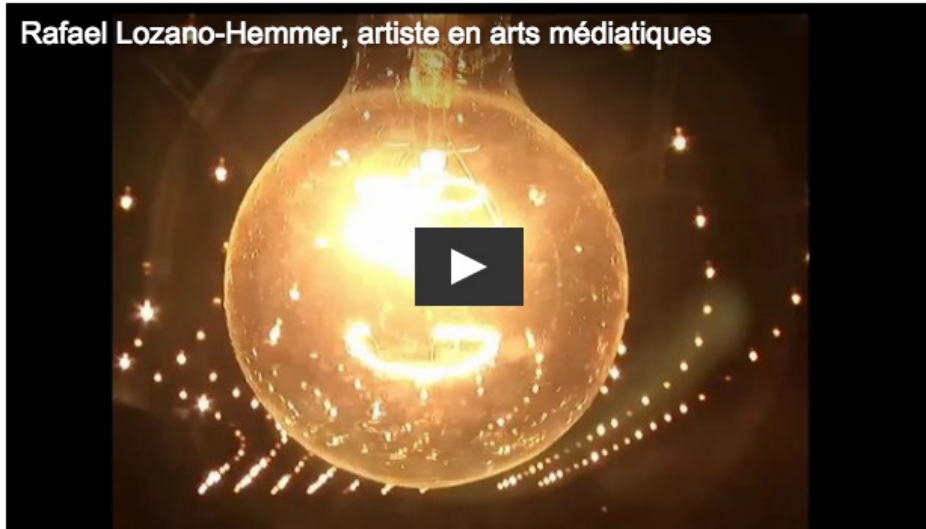
Rafael Lozano-Hemmer, artiste en arts médiatiques