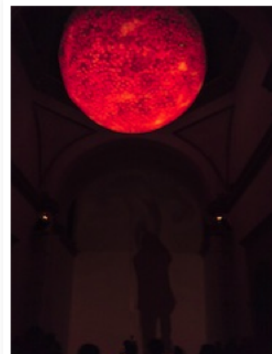
"Nave Solar" de Rafael Lozano Hemmer

Dominando la nave de la iglesia, colgada por debajo de la cúpula, se encuentra "Nave Solar" , la pieza de Rafael Lozano - Hemmer. Una enorme pantalla con forma de esfera representa, mediante ecuaciones, la actividad de la corona de nuestro sol escala 1/200 millones. Una cuerda cuelga de la esfera, una cámara percibe los movimientos de las personas presentes, y en donde sería el altar se reflejan sus sombras humeantes. La obra está cargada de referencias históricas, científicas, lúdicas y literarias: esparcidos de humo como los usados en las iglesias, los péndulos de Foucault y el mito de Ícaro; las tortura inquisitoria del péndulo descrita por Poe en "El Pozo y el Péndulo" y el juego del palo encebado.