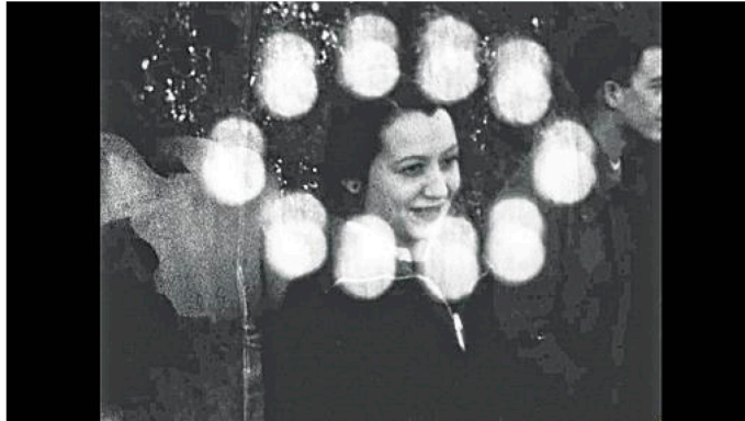
«What does History Know of Nail Biting?», de Francesc Torres (Elba Benítez)-