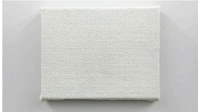
«Blank», de Karmelo Bermejo (MaisterraValbuena)-

¿Artistas imprescindibles en ARCO 2016? Pues la pintura monocroma «Blank», de Karmelo Bermejo . Cientos de capas de óleo blanco fraguadas durante meses componen esta obra en la que el bastidor, la tela y las grapas están construidas de pintura maciza (Galería MaisterraValbuena ). También «55 ways: las lectoras de Alois», de Nacho Martín Silva ; otros tantos lienzos formando una pintura de grandes dimensiones en la que unas jóvenes de la congregación de Alois Hudal posan delante de varias imágenes del Evangelio ( José de la Fuente ). Asimismo, la animación digital de David Ferrando Giraut , «Catoptrophilia», protagonizada por un espejo de mano del siglo XV perteneciente a la diosa de la belleza Hator y un iPhone. El artista está representado por Bacelos .