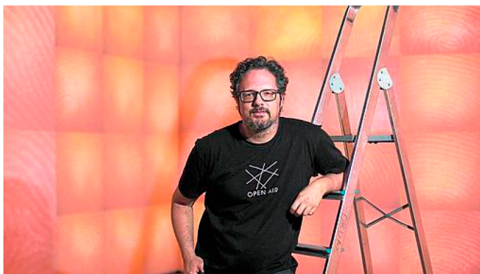
Rafael Lozano-Hemmer muestra su obra en Max Estrella- Isabel Permuy