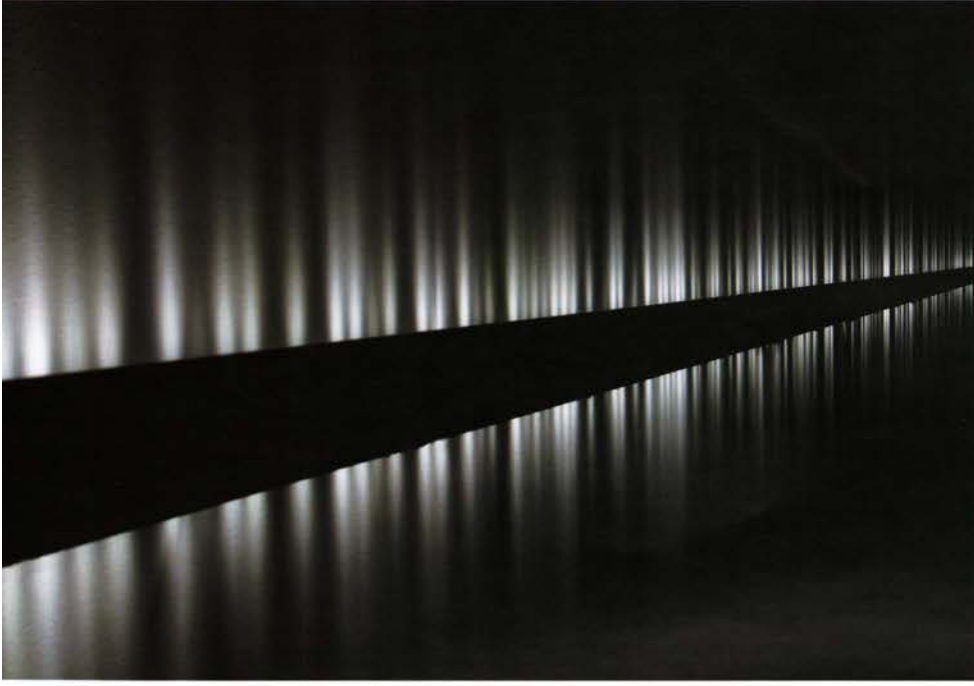
Solda "Voice Array", Subsculpture 13, 2011.