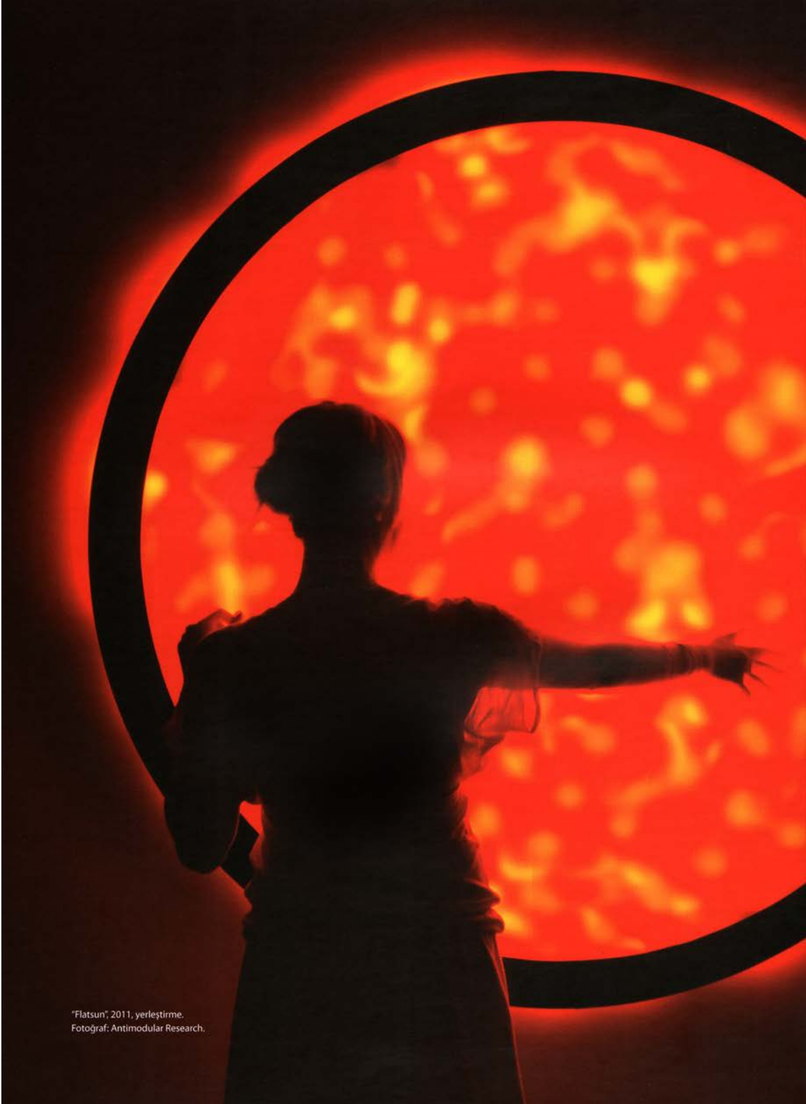
"Flatsun", 2011, yerleřtirme.